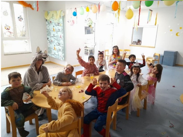
Unsere Schulkinder feierten nachmittags nach der Schule.

Herzliche Grüße von den Kindern und dem Team der Kneipp®Kita Löwenzahn