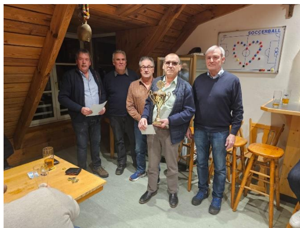
Bilder: Adalger Leick