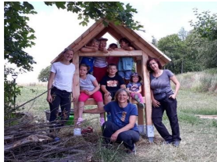
Ganz herzlichen Dank an alle Helfer

Wenn der Bau fertig ist, werden sicher die ersten Bewohner rasch einziehen. Das Hotel wurde gleich neben den frisch angelegten Hochbeeten aufgebaut. Dort wächst bereits Gemüse wie Paprika und Zucchini und dies braucht zum Wachsen auch die Unterstützung vieler Insekten. Darüber haben die Kinder im Waldkindergarten schon viel gelernt.